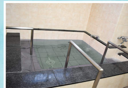
風呂場(特浴もあります)