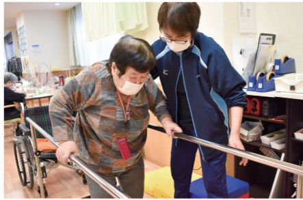
難しくなった運動そのものの練習