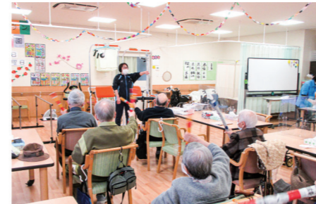
コグニサイズ(認知症予防運動)

生活に必要な機能を維持・改善し「その人らしい」生活の維持及び質の向上を目指します。