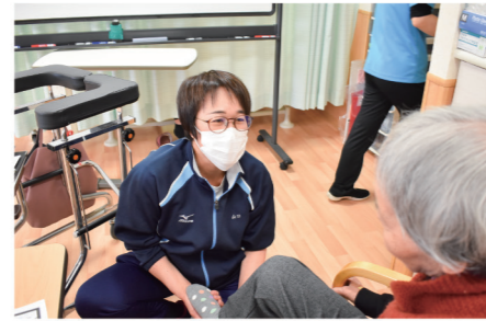
身体機能へのアプローチ(筋力・可動域等)