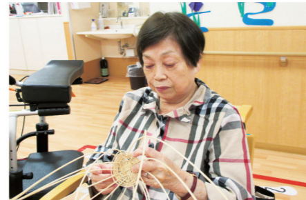
作品づくり(工作・手芸等)