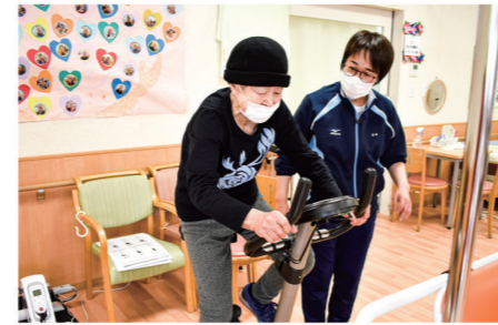
福祉用具等の利用や方法を工夫しての練習