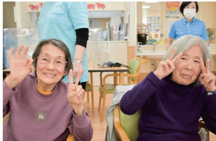
他のご利用者様との交流