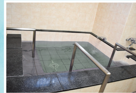
風呂場(特浴もあります)